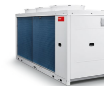
Belaria® fit (85): až 1.4 MW