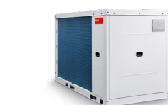
Belaria® fit (53): až 853 kW