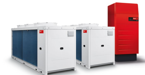
Bivalentní hybridní systém s Belaria® fit a plynovým kondenzačním kotlem UltraGas®.

Belaria® fit otevírá nové možnosti při renovaci topných systémů - stávající systémy, např. plynové kondenzační kotle, lze výhodnou investicí doplnit o Belaria® fit. Takové systémy jsou pak považovány za systémy využívající obnovitelné zdroje energie.